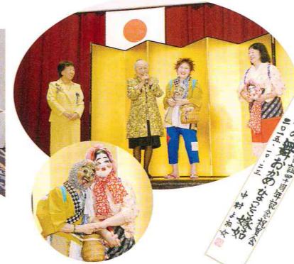
「かきやで風」 男性舞踊家による