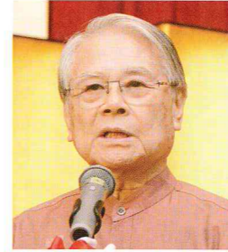
元沖縄県知事 稲嶺 恵一