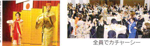
全員でカチャーシー