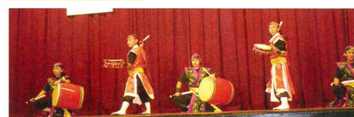
勇壮なエイサー「那覇太鼓」