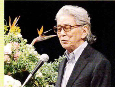
「よるこび上手こそ今を生きる力」