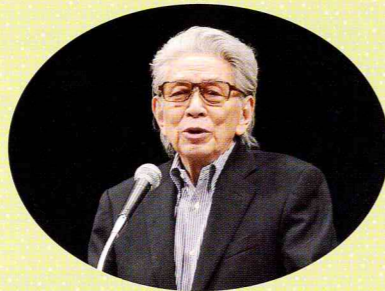
講演して頂いた五木寛之氏