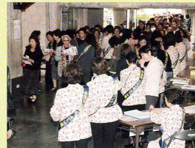
お客様をお迎えする SI 会員