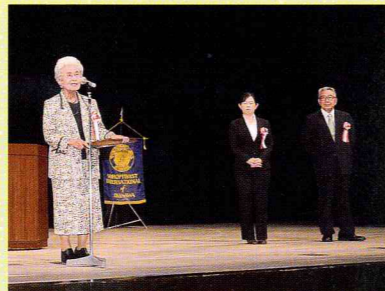
クラブ賞 受賞の皆様