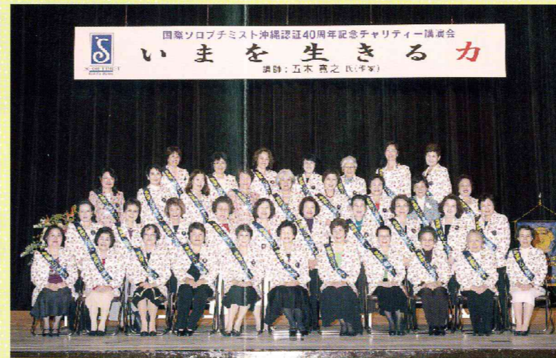
講演会開始前にパチリ